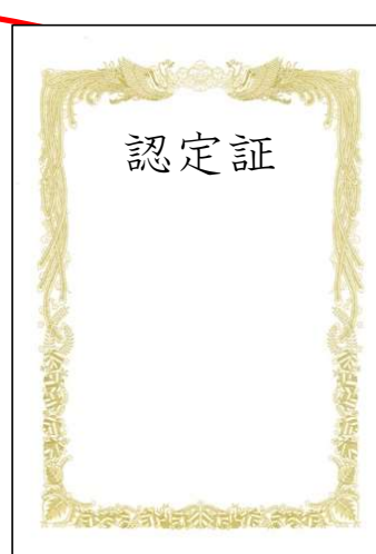
基本学会専門医認定証