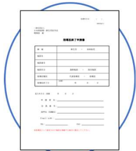
指導医終了申請書

また、指導医となった認定施設を離れる場合や、指導医を後任に引継いで終了する場合には、 (4)指導医終了申請書 をご用意いただく必要があります。