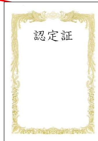
基本学会専門医認定証