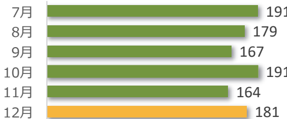
相談件数の推移（直近 6 か月）

12 月の相談件数は 181 件で、相談者の内訳は医療機関が 67 件、遺族等が 101 件、その他・不明が 13 件でした。 遺族等の求めに応じて相談内容をセンターが医療機関へ伝達したものは 5 件（累計 179 件）でした。 医療機関から医療事故の判断について相談を受け、センター合議を開催し、医療機関へ助言したものは 6 件（累計 505 件）でした。